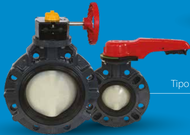
Mariposa Tipo Wafer y Lug