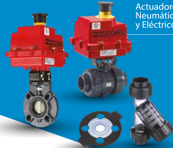
Empaques Elastoméricos y Filtros Yee